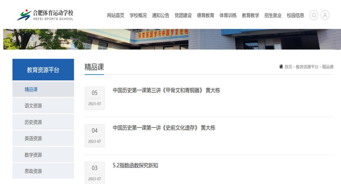
图 9 合肥体育运动学校数字化教育资源

在资源内容方面，围绕国家课程教材体系与学科教学需求，持续扩充校园网站数字化资源库，重点建设语文、数学、英语、思政、历史等学科资源，逐步扩展专业课程与校本精品课程资源（见图 9）。通过推动各教研组共建共享教学资源库，组织教师参与数字化能力培训、教学技能大赛等形式，有效提升了教师数字素养与资源应用能力，为数字化教学常态化实施奠定了坚实基础。