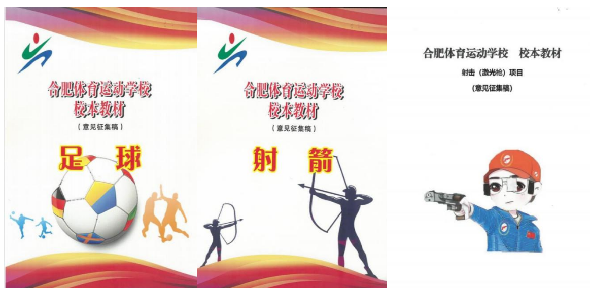
图 6 学校校本教材开发