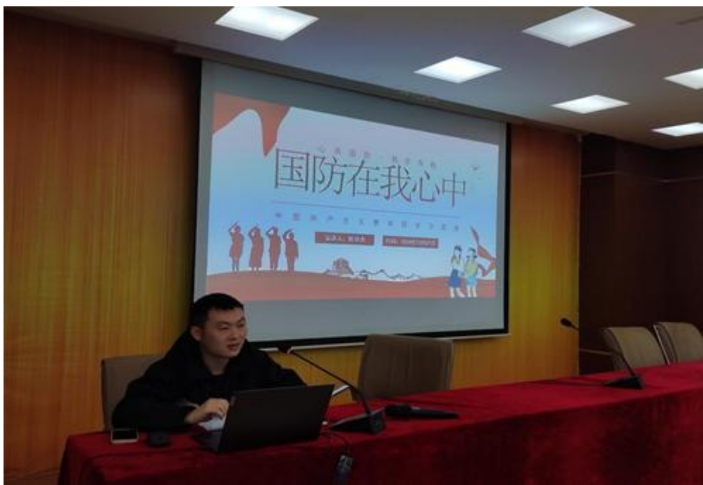
图 21 《传承红色文化，共书双拥新篇》为主题的团课活动