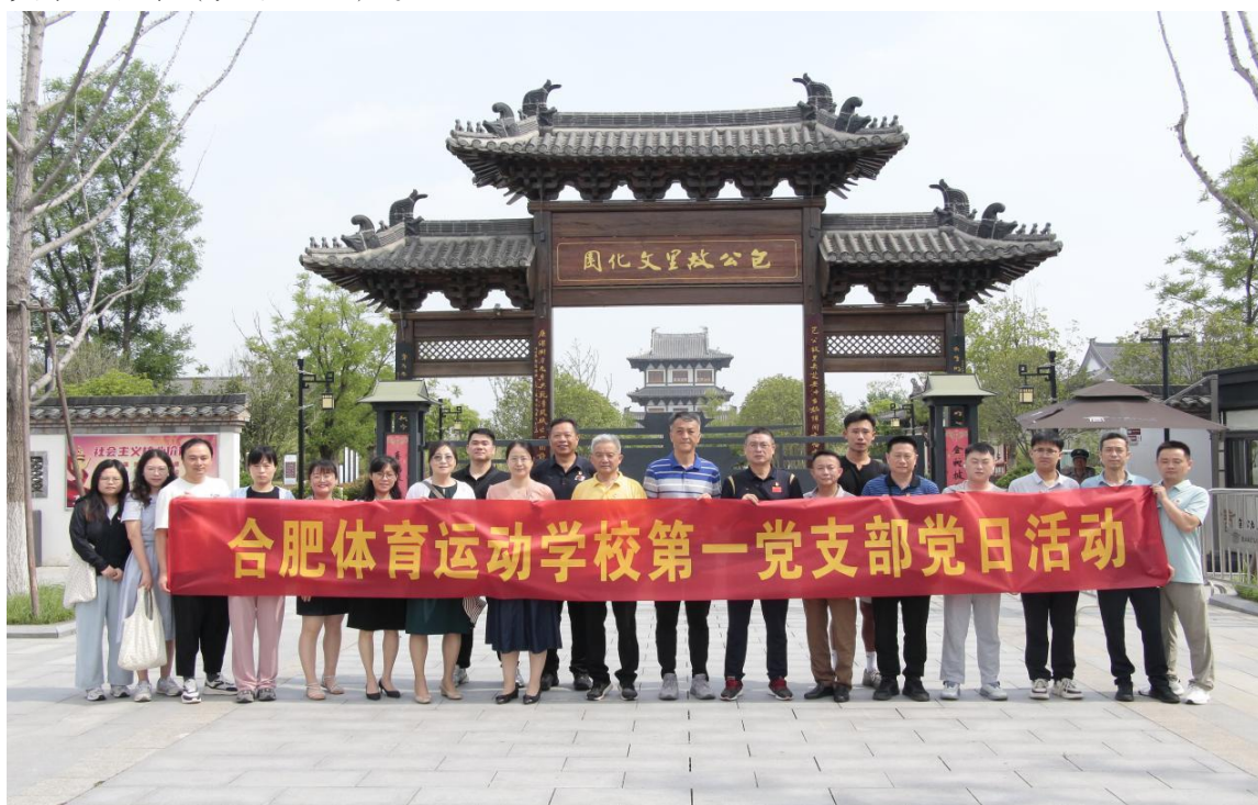
图 24 拒腐防变·主题党日活动

学校党总支坚决落实“第一议题”制度，通过组织集中学习、专题讲座等活动，以增强党员的理论素养和党性修养，将党的二十大和二十届三中、四中全会精神，习近平新时代中国特色社会主义思想精神融入到“三会一课”等日常党建活动当中。总支书记和第一支部书记分别进行“深入贯彻中央八项规定精神学习教育”和“中国共产党人精神谱系的传承与发展”专题党课。组织党员开展党日活动12次，组织党员及中层干部参加“深入贯彻中央八项规定精神学习教育”集中学习38次，并就学习心得进行交流研讨（见图24）。