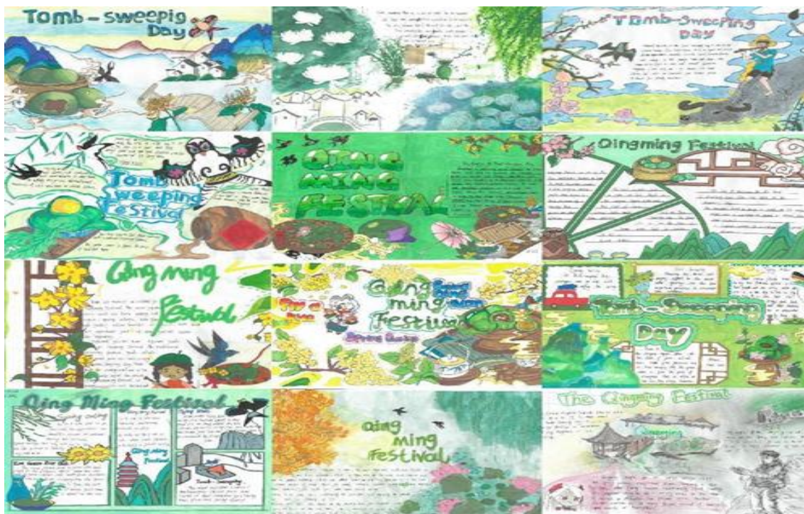
图 17 清明节英语手抄报作品展示

同时利用端午节，开展“传承中华优秀传统文化 弘扬爱国主义精神”的主题班级活动。各班级开展了丰富多彩的项目，如“巧手制作端午香包”、“师生共读《离骚》”、“品尝端午蜜粽”等（见图 18）。