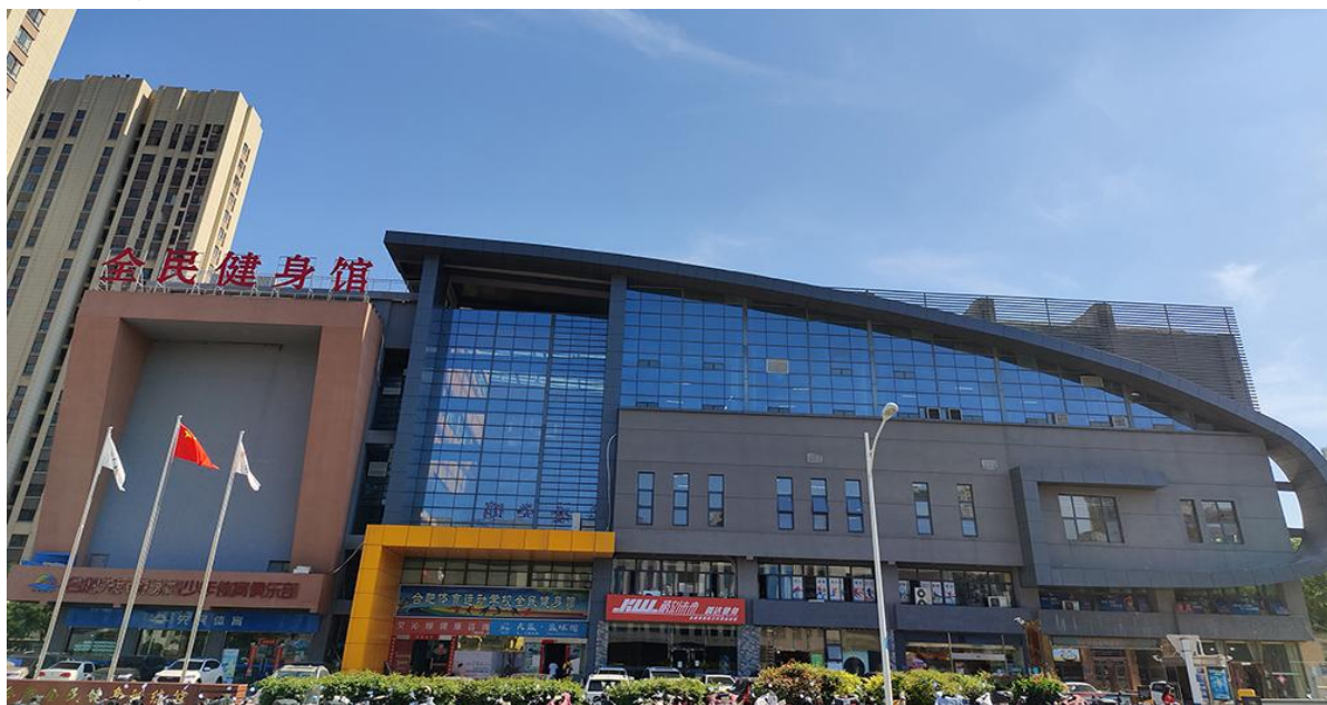
图 13 学校全民健身馆

在体育强国战略实施中，学校聚焦赛艇、皮划艇、射击等优势项目，凭借“国家高水平体育后备人才基地”的专业资质，累计为国家培养各级体育骨干 8000 余人，其中多人入选国家队征战世锦赛、世界杯、亚运会等国际赛事，斩获多项冠军荣誉，为国家竞技体育事业贡献“合肥力量”。针对健康中国战略需求，学校充分开放近 19300 平方米的全民健身训练馆和 6500 平方米的球类健身馆，年均接待群众健身超 5 万人次（见图 13），将专业体育资源转化为全民健康服务载体，助力提升国民体质健康水平。