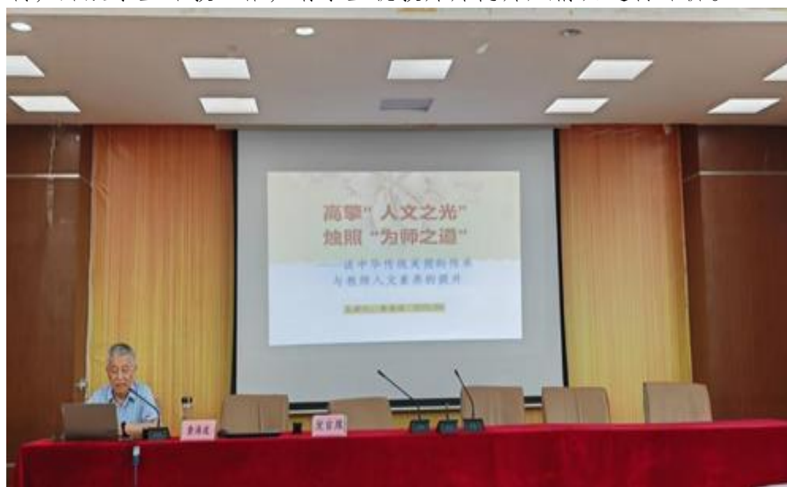
图 4 合肥体育运动学校开展师德师风培训

师德师风建设是学校教师队伍建设的核心组成部分，学校定期开展师德师风培训，帮助教师树立正确的职业观念。本年度，学校召开10次教师例会，例会中均带领教师学习师德师风相关文件或思想政治理论，引导全体教师不断强化道德意识，自觉践行道德规范；2025年8月，学校开展师德师风专题培训，邀请外校专家开展以“高擎‘人文之光’，烛照‘为师之道’——谈中华传统美德的传承与教师人文素养的提升”为题的专题讲座（见图4）。学校建立师德师风评价机制，开展学生评教工作，请学生就教师师德师风情况进行评价。