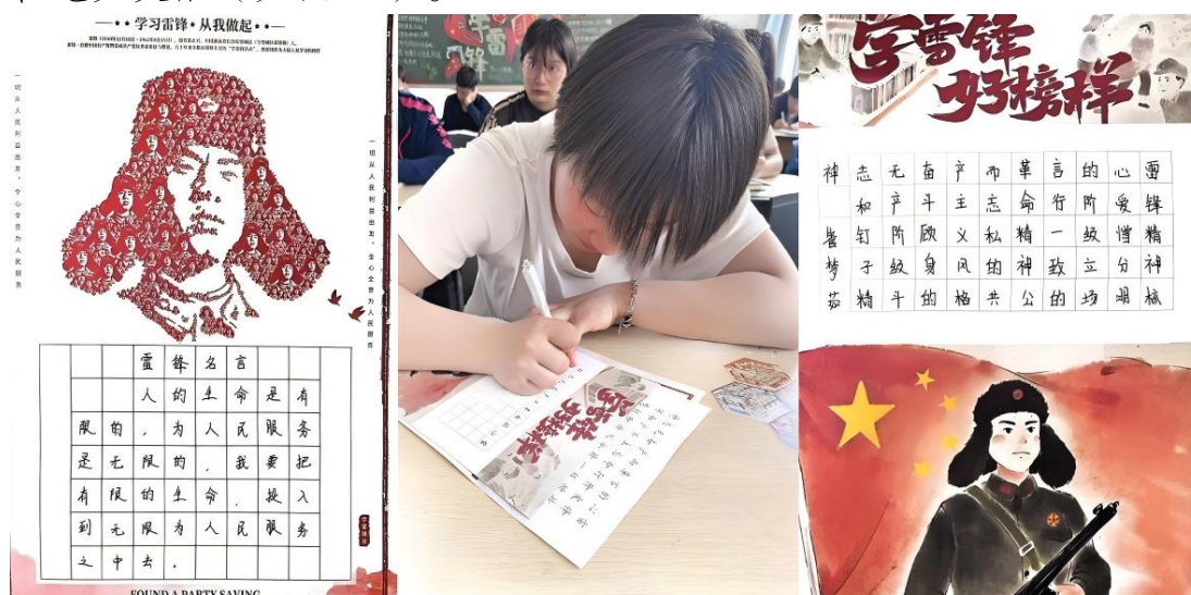
图 16 “传承雷锋精神”硬币书法比赛