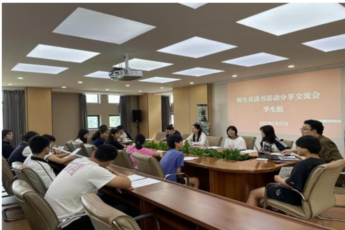
图 1 合肥体育运动学校开展“师生共读”活动交流会