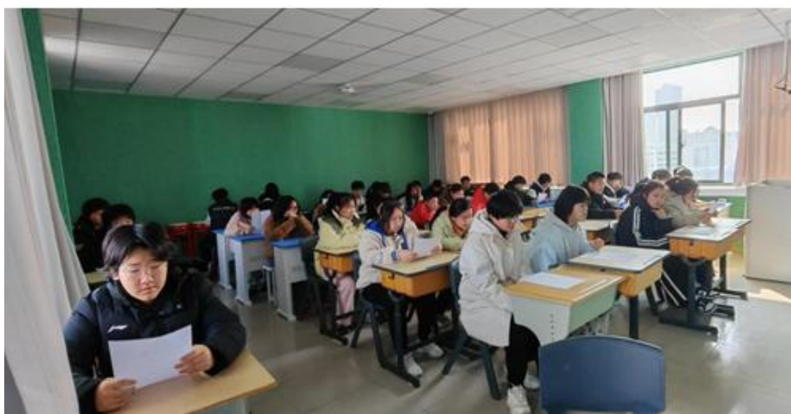
图 20 朗诵社团活动

开设朗诵社团，用声音传递力量，朗诵社团以诵读经典为宗旨，吸引了众多热爱语言艺术的学生加入。社团活动室内，学生们在专业老师的指导下，练习发声技巧、情感表达和舞台表现力。通过诵读经典文学作品，学生们不仅提升了语言表达能力，还加深了对中华优秀传统文化的理解（见图 20）。