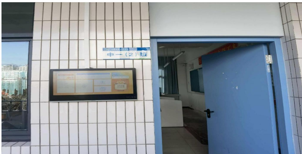
图 8 合肥体育运动学校电子班牌

在资源内容方面，围绕国家课程教材体系与学科教学需求，持续扩充校园网站数字化资源库，重点建设语文、数学、英语、思政、历史等学科资源，逐步扩展专业课程与校本精品课程资源（见图 9）。通过推动各教研组共建共享教学资源库，组织教师参与数字化能力培训、教学技能大赛等形式，有效提升了教师数字素养与资源应用能力，为数字化教学常态化实施奠定了坚实基础。