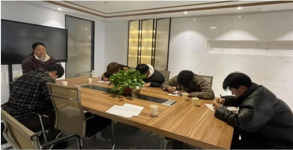
图 10 毕业生前往合肥聚速体育科技有限公司面试

合肥体育运动学校根据教育部等八部门关于《职业学校学生实习管理规定》工作要求，制定《实习手册》，积极推进 2025 届毕业学生至企业进行实习实践活动。带领意向毕业生至聚速体育、奥奇体操等公司进行面试（见图 10），与企业沟通实习安排，为 5 名学生购买实习责任险，落实实习保障。