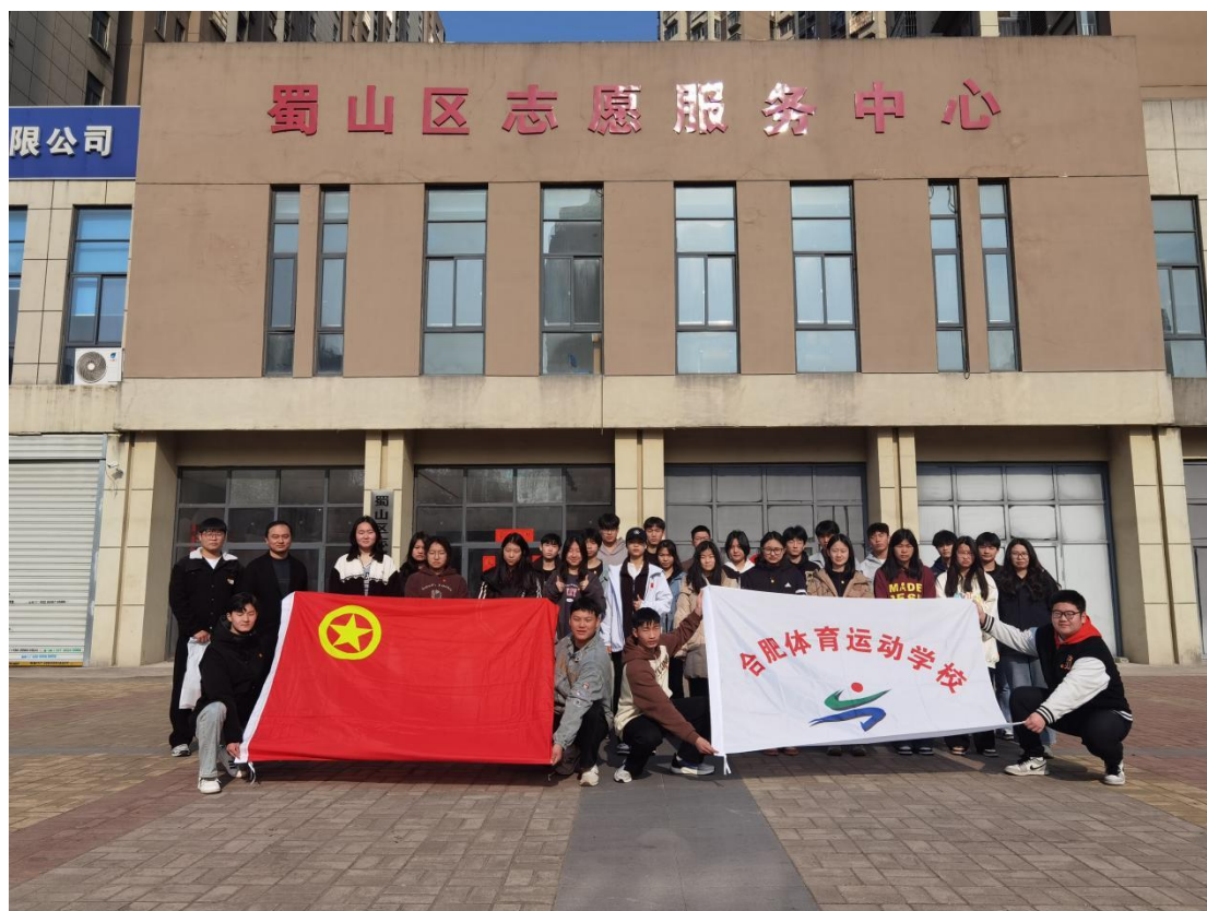
图 23 雷锋精神志愿活动

“大思政课”实践育人的重要举措，依托属地合肥市蜀山区五里墩街道的红色资源与新时代文明实践所站阵地，通过“理论学习+实地参观+仪式教育”的形式，将雷锋精神与红色精神有机结合，进一步强化了青年团员的责任意识与使命担当