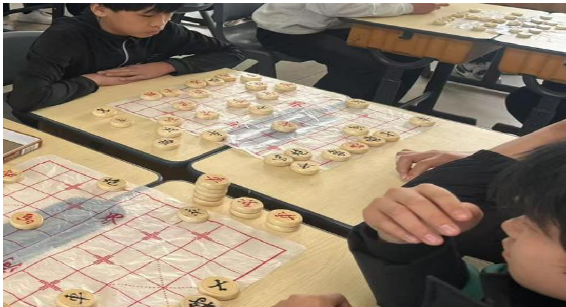
图 19 学校象棋比赛

于 2025 年 3 月 31 日完成最终决赛（见图 19）。比赛促进了各班学生之间的交流，增加了彼此的友谊，也让传统文化在校园生根发芽，让学生们在竞技中成长，于博弈中收获快乐。