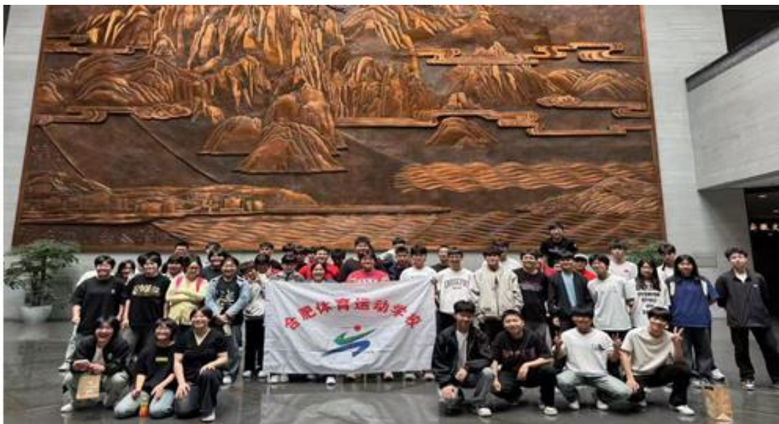
图 15 合肥体育运动学校研学游活动

举办“以书为舟，共赴成长之约”主题“师生共读”活动交流会，阅读作品包括中国传统经典读物等，师生共谈读书收获，营造氛围浓厚的阅读环境。开展“探秘文明瑰宝 厚植文化自信”研学活动，前往安徽省博物院进行参观学习（见图 15），加深对安徽历史文化的了解，让同学们亲身感受到了历史的真实氛围。