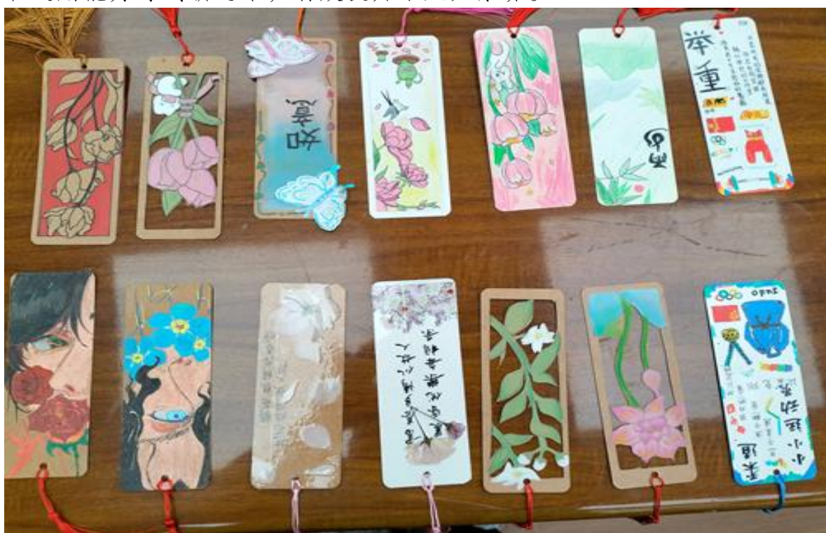
图 2 合肥体育运动学校创意书签制作活动

在体育强身、美育润心与心育护航方面，学校充分发挥自身特色并拓展育人外延。作为体育专业院校，在坚持科学训练的同时，举办“趣动青春绽活力”第三届趣味运动会及“‘棋’聚校园”象棋比赛，让学生在趣味竞技与智力博弈中享受运动乐趣，培养团队精神与规则意识，丰富了体育文化内涵。“艺迎新春”文艺汇演、各类手绘及手抄报活动，则为学生搭建了展示艺术才华的舞台，让校园充满生机与美感。学校持续关注学生心理健康，“压却无声”团体辅导、“青春护航”健康知识讲座等系列活动的开展，为学生提供了专业的心理支持与情感疏导，助力他们塑造积极乐观的心态，提升应对压力的能力。