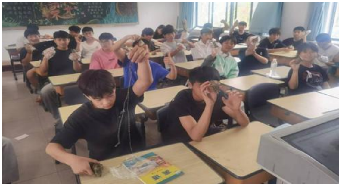
图 18 端午节包粽子活动

同时利用端午节，开展“传承中华优秀传统文化 弘扬爱国主义精神”的主题班级活动。各班级开展了丰富多彩的项目，如“巧手制作端午香包”、“师生共读《离骚》”、“品尝端午蜜粽”等（见图 18）。