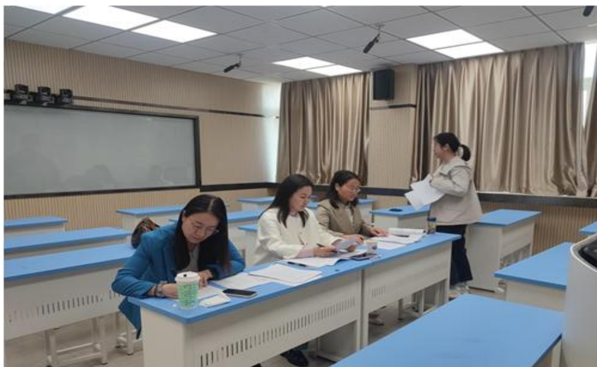
图 5 学校校级说课比赛

学校共 5 个教研组，各教研组通过开展各种形式的教科研活动，严格落实集体备课、听课评课、同课异构等制度，推动教研活动主题化、系列化，积极促进教师专业化成长。2025 年 4 月，举办校级说课比赛，为教师们提供展示教学风采、相互学习的平台（见图 5）。