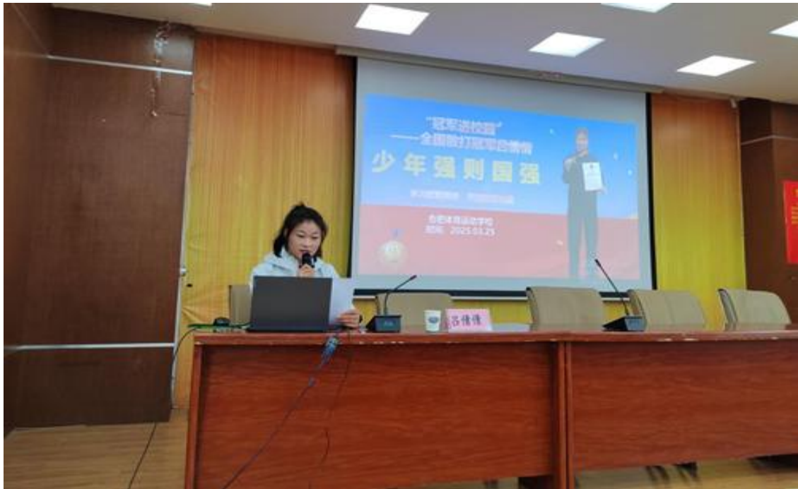
图 22 “冠军进校园”活动现场