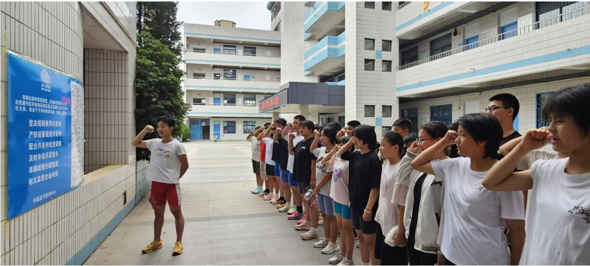
图 25 反兴奋剂宣誓活动

通过以上措施，学校已初步构建起常态化的反兴奋剂宣传教育阵地，有效提升了相关人员的基础知识与防范意识。校方表示，将持续深化反兴奋剂教育工作，坚决防范误服误用风险，护航青少年运动员健康成长，营造积极健康的校园体育文化（图 25）。